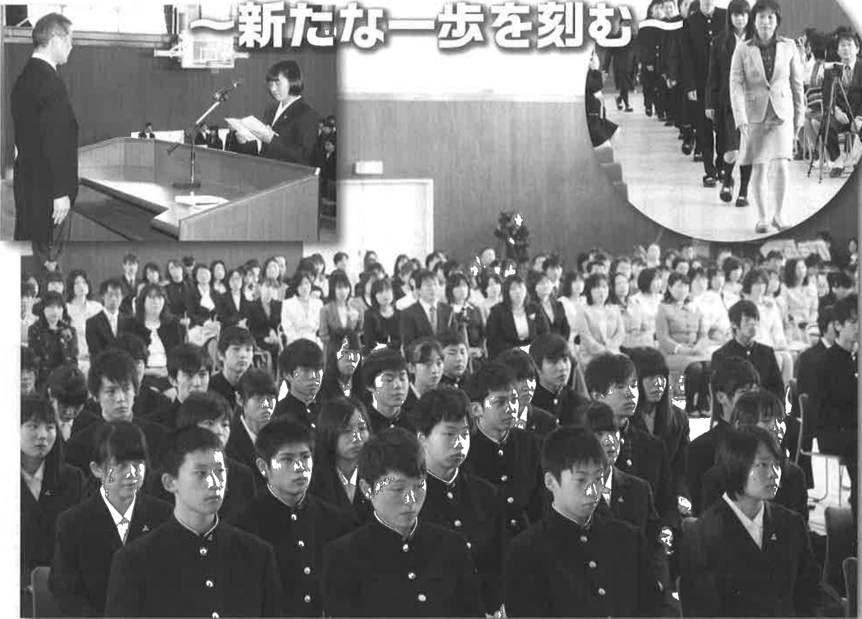
▲ 緊張の中に凛々しい眼差しの新入生