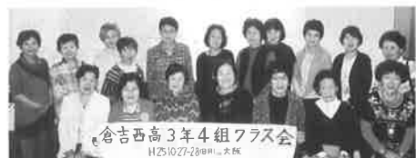
倉吉西高3年4組クラス会 H25.10.27(日) 大阪

十月二十七日(日)、市内観光と水都大阪クルージングを楽しみ、ホテル阪神にて宴会、宿泊。翌二十八日(月)は百年を迎えた通天閣に集まり、新世界で昼食、そして海遊館を廻り、次会の再会を誓い、楽しい二日間を無事に過ごしま